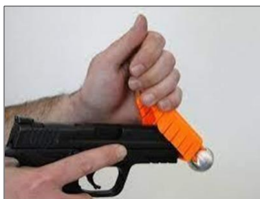
Fig. 4. Dispositivo Alternative siendo adosado a un arma convencional.

● Dispositivo alternativo: Conocido en el mercado como TheAlternative es un accesorio de proyección creado por la firma BruzerLessLethal International, dicho dispositivo es metálico de color naranja construido de una aleación ligera, se coloca sobre el tubo cañón de la pistola de servicio como si fuese un “capuchón”, a grandes rasgos su armazón está dividido por dos partes, una esfera de 30 mm de diámetro alineada con la boca del arma y una montura que es la va colocada sobre la corredera, ambos unidos entre sí por medio de pequeños vástagos. El modo de funcionamiento es sencillo, cuando el operador efectúa un disparo siempre apuntando al torso con TheAlternative colocado, el proyectil queda atrapado o envuelto por la esfera metálica la cual se separa de su montura cayendo ésta a escasos metros, en cuanto al proyectil este pierde hasta 5 veces su velocidad inicial, quedado entre 60 a 80 m/s, según la munición empleada, y crece su superficie de contacto de manera exponencial gracias al efecto envoltorio de la esfera, reduciendo de esta manera su penetración y haciendo prácticamente nula su posibilidad de herir de manera mortal al individuo.