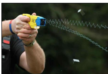
Fig. 3. Taser en su empleo.

● BolaWrap: Es un dispositivo portátil de pequeñas dimensiones, que cabe en cualquier cinturón de trabajo o chaleco, creado para la contención remota de un individuo, desarrollado por la empresa Wrap Technologies, la misma descarga una cuerda fina de Kevlar similar a un cordón de zapatos, la cual se enrolla de forma segura sobre el mismo, permitiéndole al agente del orden reducirlo desde una distancia segura, priorizando la integridad física de ambos como así también de terceros. Posee una velocidad de descarga 156 m/s, velocidad de envoltura 82 m/s a 3 metros de distancia produciendo entre 1 a 3 envolturas dependiendo la circunferencia sobre la que actúa, distancia recomendada de uso de 3 a 8 metros, tiempo de recarga de 2 a 6 segundos dependiendo del entrenamiento, volumen de sonido 105 dB, peso de 340 gr con cartucho, posee un láser para mejor precisión, es de fácil manejo y dos de las mayores ventajas es que no causa dolor a la persona que se reduce y garantiza un espacio seguro entre éste y el oficial de policía. Precio de mercado: U$S750.