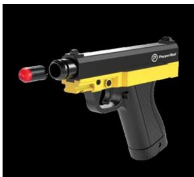
Fig. 1. PepperBall – Pistola y proyectil.

A fin de ejemplificar alguno de los armamentos y equipamientos de carácter no letal que son utilizados por agencias de seguridad en el mundo, mencionamos: