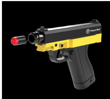
Fig. 1. Pepperball – Pistola y proyectil

A fin de ejemplificar alguno de los armamentos y equipamientos de carácter no letal que son utilizados por agencias de seguridad en el mundo, mencionamos: