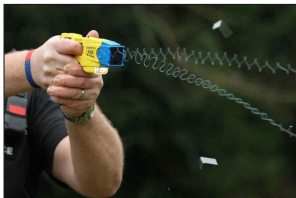
Fig. 3. TASER en su empleo.

● BOLA WRAP: Es un dispositivo portátil de pequeñas dimensiones, que cabe en cualquier cinturón de trabajo o chaleco, creado para la contención remota de un individuo, desarrollado por la empresa Wraptotechnologies, la misma descarga una cuerda fina de Kevlar similar a un cordón de zapatos, la cual se enrolla de forma segura sobre el mismo, permitiéndole al agente del orden reducirlo desde una distancia segura, priorizando la integridad física de ambos como así también de terceros. Posee una velocidad de descarga 156 m/s, velocidad de envoltura 82 m/s a 3 metros de distancia produciendo entre 1 a 3 envolturas dependiendo la circunferencia sobre la que actúa, distancia recomendada de uso de 3 a 8 metros, tiempo de recarga de 2 a 6 segundos dependiendo del entrenamiento, volumen de sonido 105 dB, peso de 340 gr con cartucho, posee un láser para mejor precisión, es de fácil manejo y dos de las mayores ventajas es que no causa dolor a la persona que se reduce y garantiza un espacio seguro entre éste y el oficial de policía. Precio de mercado: U$S 750.