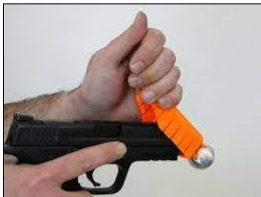
Fig. 4. Dispositivo Alternative siendo adosado a un arma convencional.

Dos de los modelos más reconocidos son los Taser X2 y Taser X26P los cuales poseen las mismas características con la excepción que el primero tiene la ventaja de poder alojar dos cartuchos logrando efectuar de esta manera dos disparos consecutivos de serlo así necesario; ambos utilizan nitrógeno comprimido para lanzar los dardos los cuales abandonan el dispositivo a una velocidad de 50 m/s y que alcanzan aproximadamente una distancia máxima de 10 metros; poseen memoria digital para el almacenamiento de datos encriptados como por ejemplo nombre del usuario, fecha y hora, datos de la descarga aplicada, entre otros; también graban audio y video a partir del momento que se le quita el seguro; son estancos los cuales poseen gran resistencia frente a lluvias, humedad, temperatura y otros factores climáticos; cuentan además con un sistema de autodiagnóstico que le permite al operador ver el estado de funcionamiento del mismo. Precio de mercado dependiendo de la marca y modelo: desde U$S 1.200 a U$S 1.800.