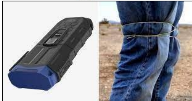
Fig. 2. Lanzador y efecto de restricción.

● BOLA WRAP: Es un dispositivo portátil de pequeñas dimensiones, que cabe en cualquier cinturón de trabajo o chaleco, creado para la contención remota de un individuo, desarrollado por la empresa Wraptotechnologies, la misma descarga una cuerda fina de Kevlar similar a un cordón de zapatos, la cual se enrolla de forma segura sobre el mismo, permitiéndole al agente del orden reducirlo desde una distancia segura, priorizando la integridad física de ambos como así también de terceros. Posee una velocidad de descarga 156 m/s, velocidad de envoltura 82 m/s a 3 metros de distancia produciendo entre 1 a 3 envolturas dependiendo la circunferencia sobre la que actúa, distancia recomendada de uso de 3 a 8 metros, tiempo de recarga de 2 a 6 segundos dependiendo del entrenamiento, volumen de sonido 105 dB, peso de 340 gr con cartucho, posee un láser para mejor precisión, es de fácil manejo y dos de las mayores ventajas es que no causa dolor a la persona que se reduce y garantiza un espacio seguro entre éste y el oficial de policía. Precio de mercado: U$S 750.